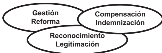
Figura 1. Representación esquemática de clasificación de contenidos de los conflictos frente a los extractivismos. A su vez, cada uno de estos tipos puede expresarse en horizontes enfocados en la coexistencia o rechazo del extractivismo.

extractivismos en tres tipos: (1) reconocimiento y legitimación, (2) gestión y reforma, y (3) compensación e indemnización (Figura 1).