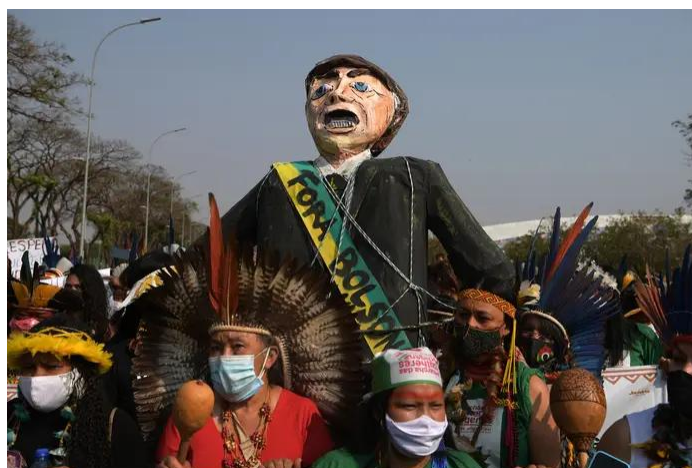
Protestas de pueblos indígenas contra Jair Bolsonaro. Brasil, 2022.

Las nuevas derechas hacen que la situación sea ahora todavía más complicada. Alentadas por el extremismo de D. Trump en Estados Unidos, no han dudado en tomar medidas radicales, tales como anular ministerios del ambiente (tal como hicieron J. Milei en Argentina y D. Noboa en Ecuador).