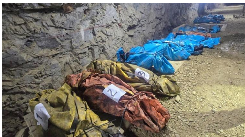
Extrema violencia en los extractivismos: cuerpos de 13 personas asesinadas en La Libertad, en el norte de Perú, en el marco de enfrentamientos entre mineros y de éstos con bandas criminales (mayo 2025).

Debe comprenderse que los extractivismos están sumergidos dentro de condiciones que a todas luces serían intolerables: desde el tráfico de niñas y adolescentes a los campamentos mineros a la contaminación con mercurio de los ríos, desde la invasión y desplazamiento de comunidades a los asesinatos. Pero de todas maneras se mantienen. En ello se evidencia que, otra vez, inciden los efectos derrame, ya que se alteran a un nivel muy profundo los sentidos de la justicia, y la delimitación entre situaciones aceptables e inaceptables.