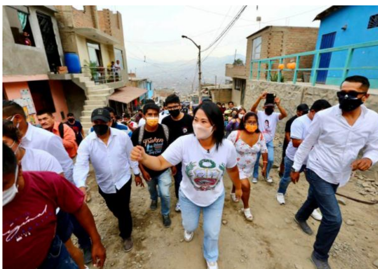
Keiko Fujimori (Fuerza Popular) en un acto en San Juan Lurigancho; abril 2021. Reproducido de la cuenta oficial en Facebook.