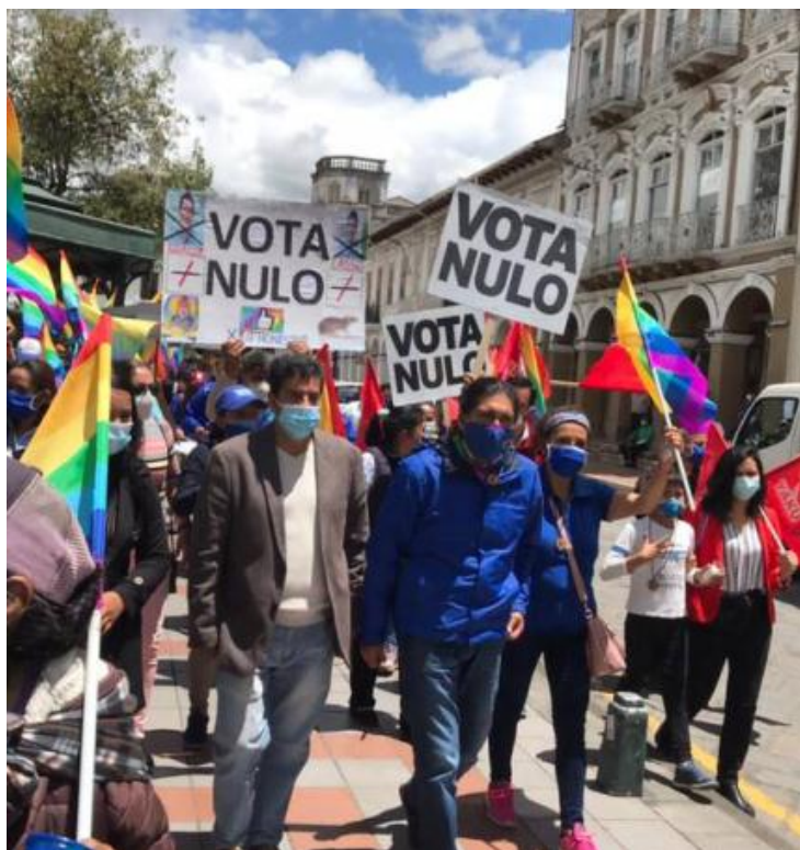
Ecuador: Yaku Pérez, al frente, candidato presidencial de Pachakutik – Movimiento de Unidad Plurinacional, en una marcha por el voto nulo en el balotaje.

El progresismo transnacionalizado atacó repetidamente a Pachakutik y a Pérez, tildándolo de conservador, neoliberal, espía, etc., tanto a él, como a su pareja, y al propio partido. Incluso se llegó a demostraciones de racismo (como los dichos del español Juan Carlos Monedero, de PODEMOS, sobre quién es verdadero indígena y quien no). De todos modos, Pachakutik casi alcanzó el segundo lugar en la primera vuelta de Ecuador, y durante varias semanas estuvieron en el centro de una dura polémica sobre la calidad del acto electoral, lo que alimentó más ataques desde el progresismo.