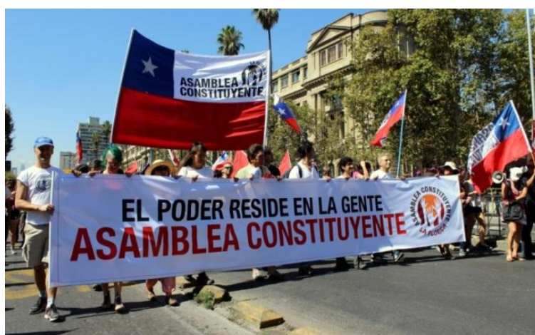
Marcha en reclamo de una Asamblea Constituyente en Santiago de Chile

El llamado a una constituyente implica ir hacia un espacio institucional primario en organizar la política nacional; su condición fundacional antecede a los partidos políticos, al Estado y a la institucionalidad. Lo que de ella resulte determinará el acuerdo social que regirá la política del país por las próximas décadas. Es entonces en esta dimensión en que deben actuar las organizaciones de la sociedad civil, que de algún modo podría describirse como promover que todos y cada uno se interese, reflexione y actúe como si estuviera construyendo una política nacional todos los días.