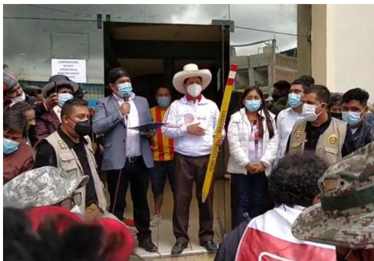
Pedro Castillo (Perú Libre) en un acto en Cajamarca; mayo 2021. Reproducido de la cuenta oficial del candidato en Facebook.

Si se pone el foco en el programa de Perú Libre, se presenta a un “extractivismo sostenible y responsable”, lo que es una contradicción en sí misma, ya que ninguna variedad de extractivismo minero o petrolero puede ser sostenible en tanto depende de recursos no renovables. El marco conceptual en ese programa parecería referirse al que se aplicó en Bolivia, Ecuador y Venezuela, afirmando que sólo se puede “salir del subdesarrollo” gracias a ese “extractivismo sostenible y responsable”, y éste sería diferente de uno neoliberal irresponsable e insostenible 9 .