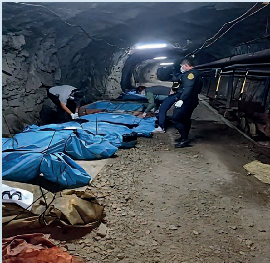
Cadáveres de mineros asesinados en un socavón en Pataz (La Libertad, Perú), a fines de abril del 2025.